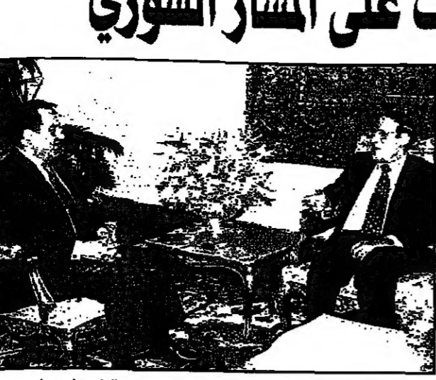
حسني مبارك ومحمود الزعيبي في لقائهما امس في القاهرة